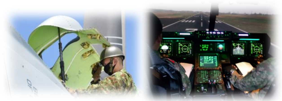
安全対策措置の様子（イメージ）

日々の飛行の際に事前に作成する運用計画についても、「特定の部品の不具合」による事故を防ぐための手順を整理し、この計画に反映させます。