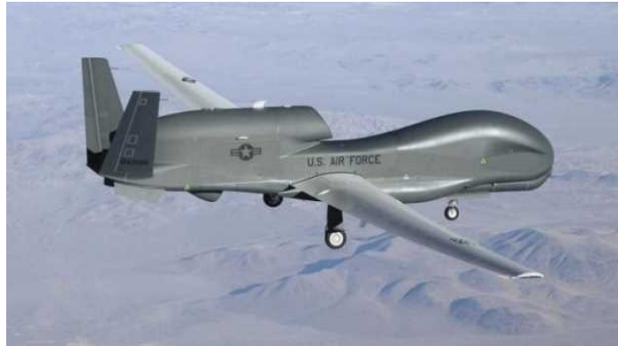
RQ-4B (グローバルホーク)