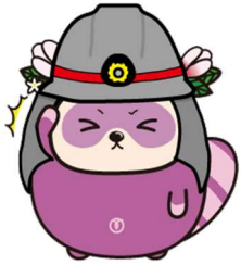
Opisyal na mascot ng bayan ng Mizuho みずほまる