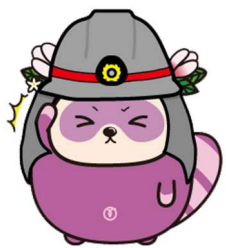
Nhân vật chính thức của TP Mizuho みずほまる