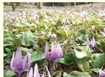
群生するカタクリ