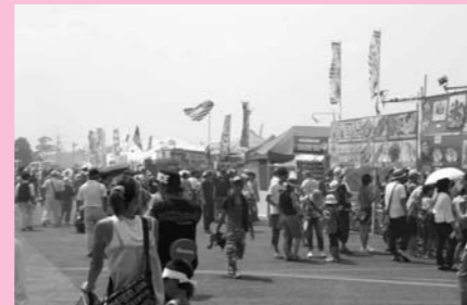
▲毎年基地内が大勢の人でにぎわいます