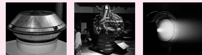
はやぶさの帰還カプセル(カットモデル) H2ロケットエンジン(実機) はやぶさのイオンエンジン

日時 8月17日(金)～26日(日) 午前9時～午後9時30分 会場 ゆとろぎ展示室