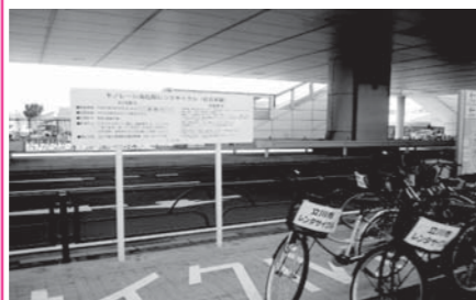
レンタサイクルの例