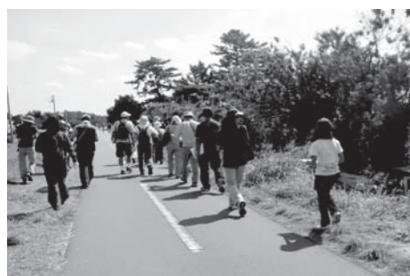
ウォークラリーの様子

この計画の取り組みは、協働型社会形成の推進でもあります。町民や事業所、地域団体の皆さまと行政が、対等な関係で参画していただくよう願います。