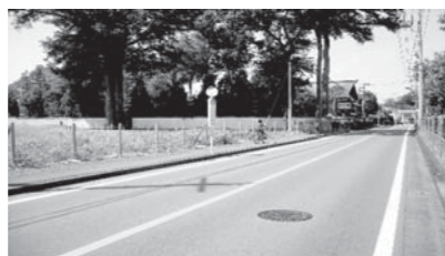
郷土資料館建設予定地