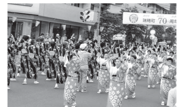
▲昨年の流し踊りコンクール

歩行者専用 午前10時～午後7時 臨時駐車場 午前10時～午後7時 ※臨時駐車場以外への駐車はご遠慮ください。 トイレ