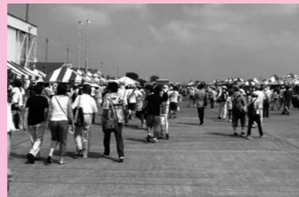
▲毎年基地内が大勢の人でにぎわいます