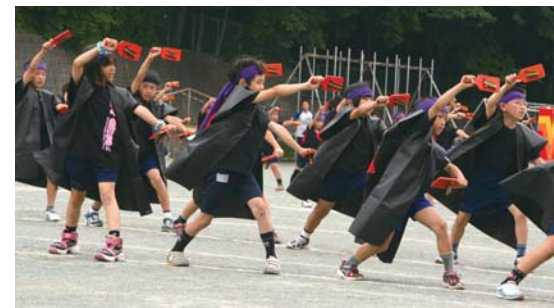
▲3・4年生による団体演技 (6月12日)