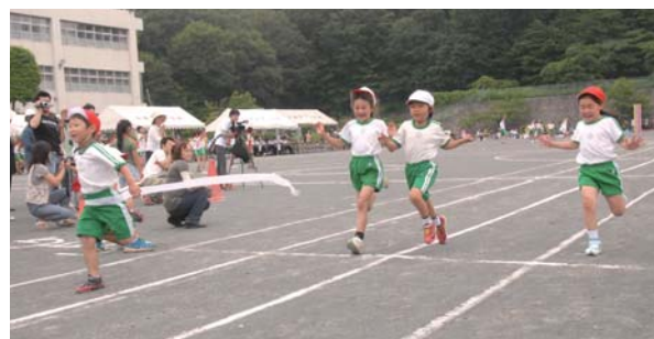
▲1年生による50m走 (6月12日)