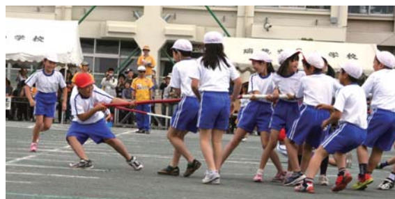
▲3・4年生による棒引き (5月31日)