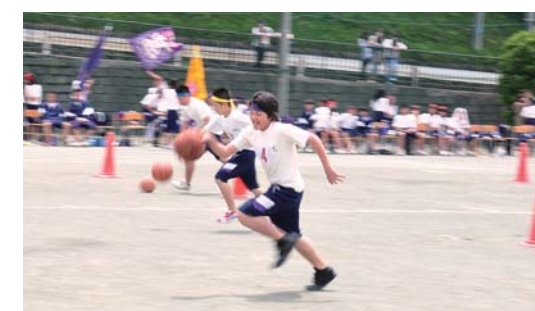
▲1、2、3年生によるバスケットリブラー (5月31日)