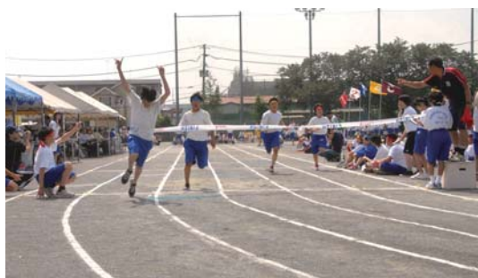
▲1、2、3年生による50m走 (6月4日)