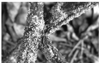
▲クワシロカイガラムシが発生した茶の木

多発すると茶の芽伸びが悪くなるだけでなく、枝や株が枯死する被害が発生します。特に5月末にこの虫の第一世代が発生しますので、この時期に薬剤散布により防除するようお願いいたします。