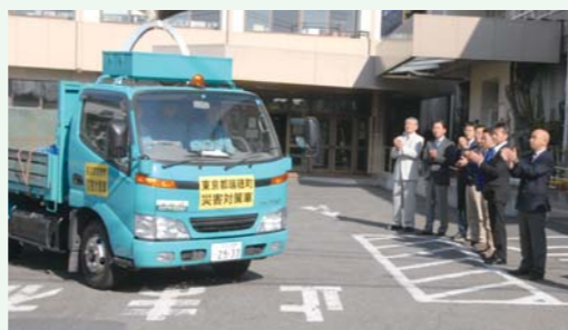
▲被災地派遣職員の見送り

東日本大震災の災害廃棄物を処理するため、先発3名、後発3名の、計6名の瑞穂町職員が、宮城県仙台市へ派遣されました。