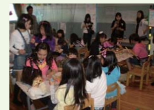
▲昨年の子どもまつり

♪お化け屋敷 大人気のコーナーだよ。 こわーいお化けたちが あなたを待っているぞ～!