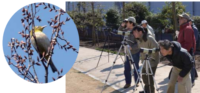
▲望遠鏡で野鳥を観察

野鳥を中心とした生きものを、瑞穂自然科学同好会の案内のもと、観察会を行いました。