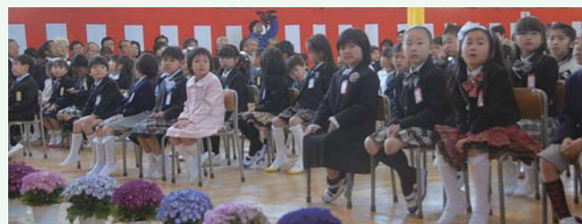
▲三小の入学式（4月6日）