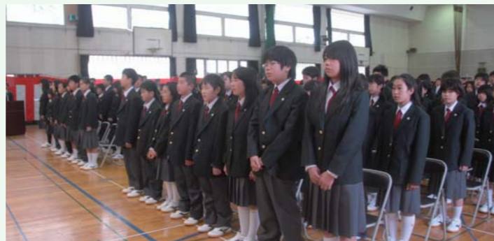
▲瑞中の入学式（4月7日）