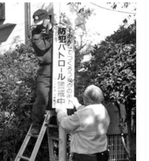
▲緑道に防犯パトロール 看板を設置しました