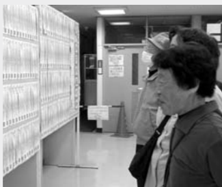
▲産業まつりでの展示風景

今年も産業まつりに川柳展示コーナーを開設しました。その後、武蔵野・元狭山コミュニティセンターへと会場を移し、大勢の方にご覧いただきました。