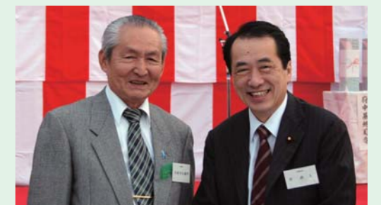
自衛隊府中基地観桜会にて

あります。三十数年前に毎日擦れ違っていた私たちが、今桜を見る席にいる不思議が思われました。毎年毎年総理大臣が代わるこのごろの日本は、国際的地位の下落に甚だしいものがあります。一刻も早く国内を安定させ、アジアのリーダーとしての自信を取り戻してほしいと強く思います。