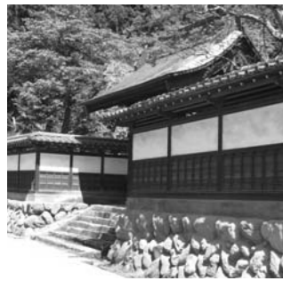
▲白壁に囲まれた大悲願寺

ジュニア前期 バドミントン大会 申し込み 8月13日(金)までに社会教育課へ ☎557-6695