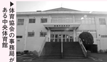
体育協会の事務局がある中央体育館