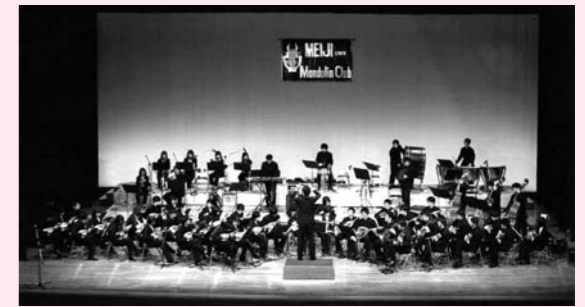
▲明治大学マンドリン倶楽部

日時 10月23日(土)午後4時30分開演 場所 スカイホール大ホール 入場料 1,000円(全席指定) ※小学校入学前のお子様の入場はご遠慮ください。 前売り ○スカイホール…8月14日(土)午前9時から ○耕心館…8月15日(日)午前9時から ○J Aにしたま本店…8月16日(月)午前9時から ○西多摩新聞社…8月16日(月)午前10時から 電話予約 8月14日(土)午後1時からスカイホールへ