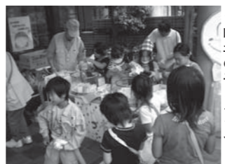
▲昨年の子どものまつり