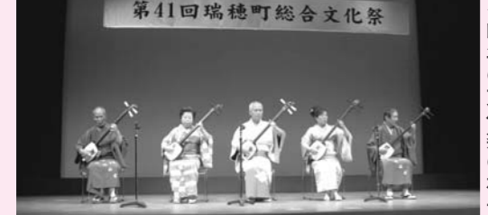
▲昨年の文化祭の様子