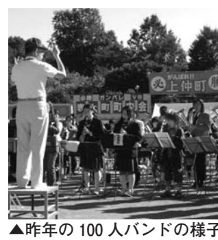
▲昨年の100人バンドの様子

期間 4月から平成23年3月までの原則土曜日(全25回程度) (春休み、夏休み、冬休みは除きます) 時間 午前9時～11時 開校式 4月17日(出) 午前9時から 場所 瑞穂町図書館2階 視聴覚室 内容 吹奏楽演奏の基礎知識と基本技術の習得 ※町民体育祭の100人バンドへの参加を予定しています。 対象 町内在住の小学4年生から高校生 定員 40名 申込み 社会教育課 ☎ 557-6695