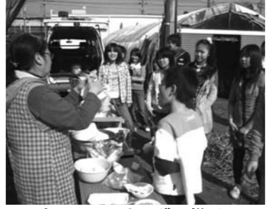
▲アウトドアクッキングの様子

の人たちや違う学校の友だちとコミュニケーションを図ることにより、社会性や協調性を身に付けます。 内容 ▼ジュニアリーダー養成講座(年10回程度) ▼子ども対象事業のボランティア活動体験 ※詳細については、その都度お知らせします。昨年は春季・夏季キャンプ(1泊2日)、アウトドアクッキング、マジックなど、いろいろな技術を学びました。