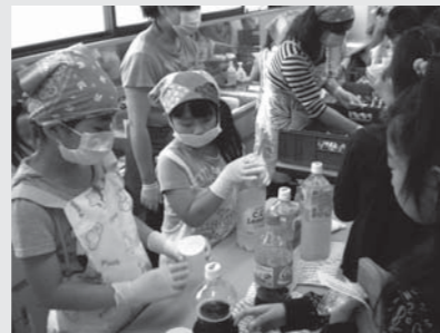
▲昨年の子どものまつり