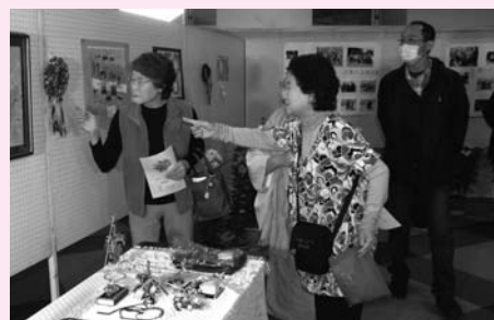
▲昨年の様子（スカイホール）

日時 10月30日(土)・31日(日)、11月1日(月)・3日(祝)・5日(金)～7日(日) 午前10時から 場所 スカイホール、郷土資料館 ※詳しくは、10月中旬に各家庭へ配布されるプログラムをご覧ください。