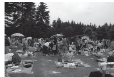
◀6月に行われたフリーマーケット

申込み 10月8日(金)(出店者多数の場合、期限前に締め切ることがあります)までにリサイクルプラザへ