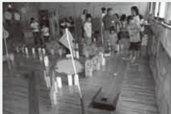
▲昨年の子どもまつり