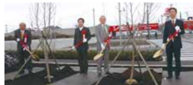
▲ハクモクレンを植樹しました