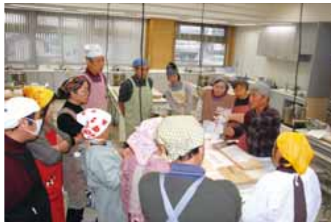
▲真剣に先生の説明に聞き入ります