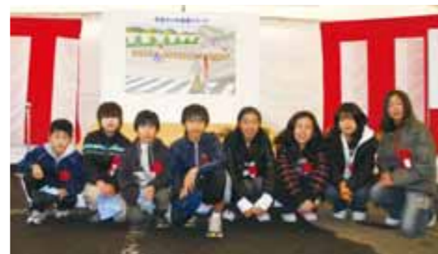
▲除幕した二小の子どもたち