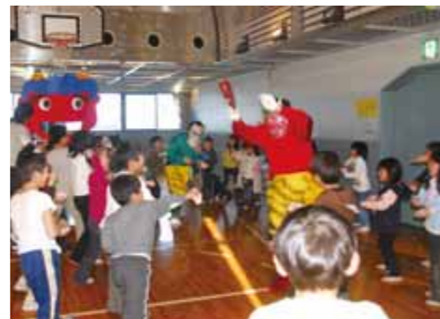
▲大勢の子どもたちが参加しました

あすなる児童館で、豆まきが行われました。子どもたちは、元気よく豆を投げ、大声で鬼を追い出し、福は内と叫んでいました。