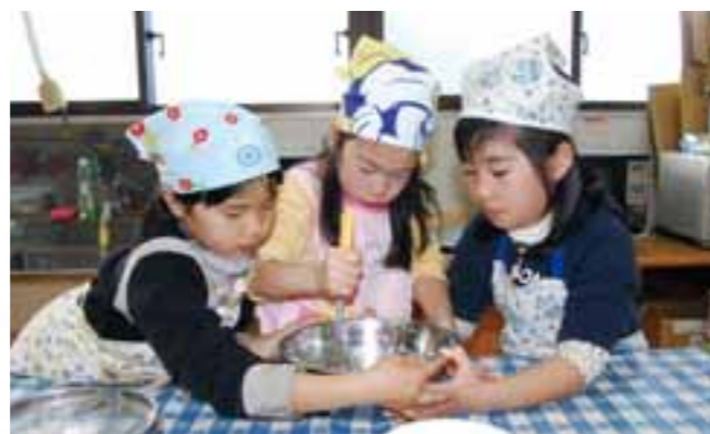
▲協力し合いながら作りました

今回は、バレンタインデーということもあり、ココアクッキーを作りました。自分で粉をこねて作ったクッキーは、とてもおいしく、みんな笑顔がこぼれていました。