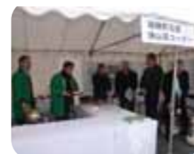
▲狭山茶コーナーも開設