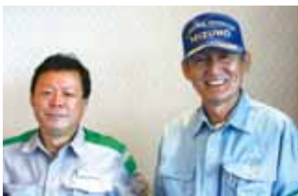
猪瀬副知事と（昭島市にて）

東京都・4市1町合同総合防災訓練でお会いできた訳ですが、私はこの方と、このような形で面会できることは夢にも思っておりませんでした。世の中には予想できない、こともあるものです。