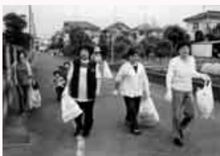
▲昨年の一斉清掃の様子

日 時 6月3日(日) 実施合図 午前8時に防災無線で放送します。 (小雨決行、大雨の場合は中止)