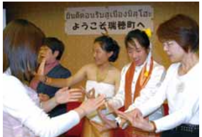
▲タイのダンスで交流