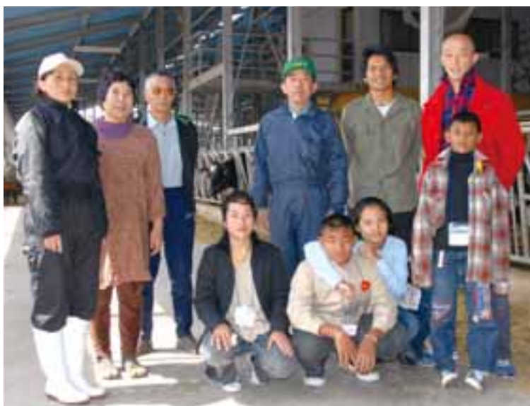
▲農業体験が終了し、ホームステイ先の家族と一緒に