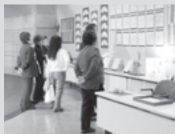
昨年の文化祭から