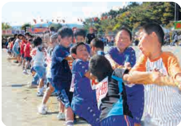
一致団結し、綱を引っ張りました。