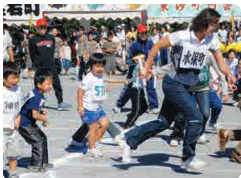
お子さんからのバトンをしっかりキャッチ