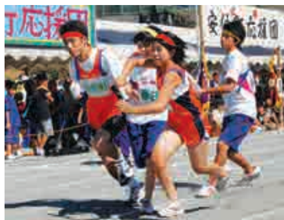
迫力の年齢別リレー