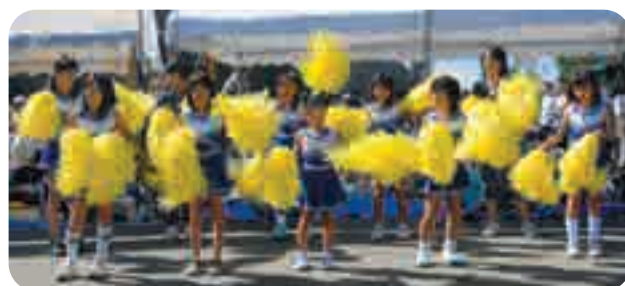
かわいらしい応援団も登場