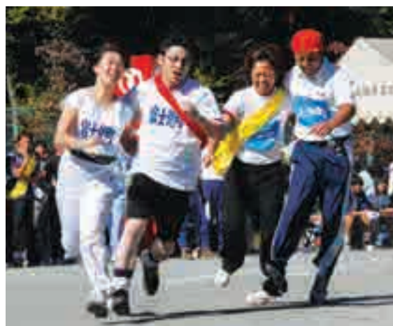
白熱した二人三脚リレー