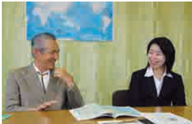
出発に先立ち、町を表敬訪問（9月27日）