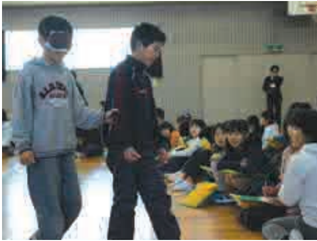
▲アイマスクをして介助役の誘導で視覚障害者の歩行体験。介助する場合は、声を掛けながら誘導することが大事です。

4年生の総合的学習の時間に福祉体験授業が行われ、視覚障害をお持ちの方の体験談や盲導犬の接し方などを学びました。