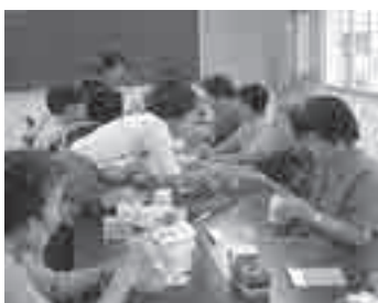
▲ふれあい・いきいきサロン