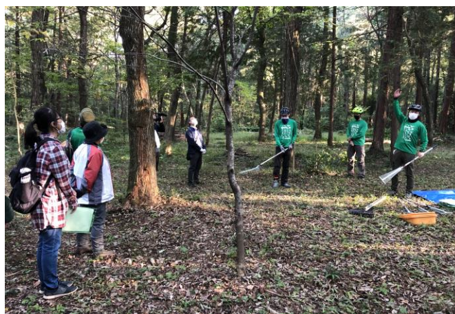
瑞穂ふるさと大学（自然コース）

○10月17日（日）にフリーマーケットと併せて環境啓発事業を実施する予定でしたが、新型コロナウイルス感染拡大防止のため、中止となりました。