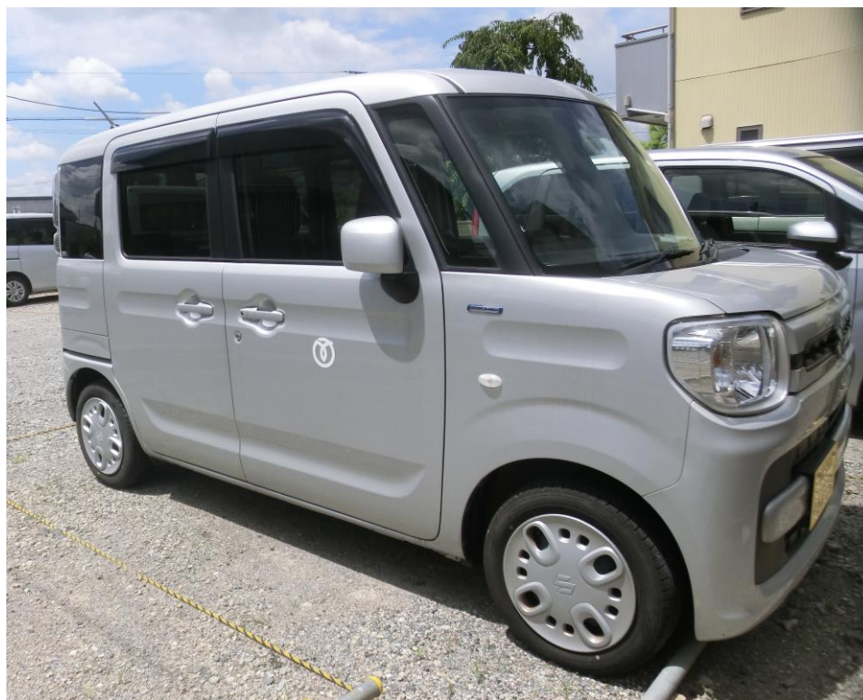
ハイブリッド自動車

令和4年度は、2台の買い替えを予定しています。これらの車両については使用用途から、電気自動車、ハイブリッド自動車の購入予定はありませんが、低燃費車等の車両を選定し環境負荷の低減を図ります。