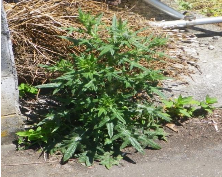
アメリカオニアザミ