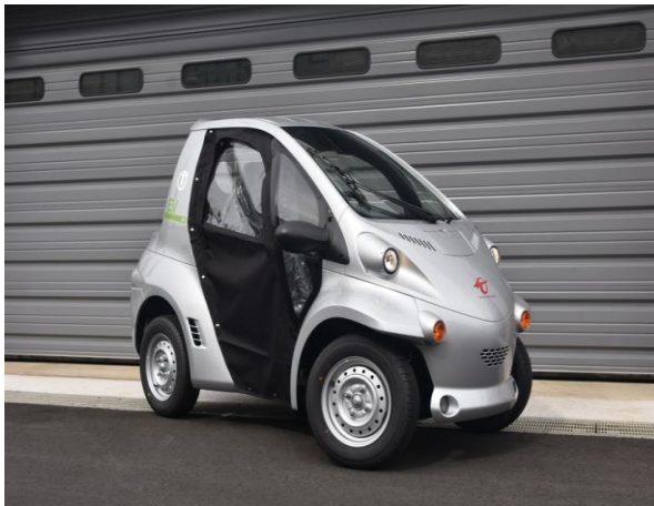
超小型電気自動車

令和3年度は、1台の新規購入、2台の買い替えを予定しています。これらの車両については、使用用途から、電気自動車、ハイブリッド自動車の購入予定はありませんが、低燃費車等の車両を選定し環境負荷の低減を図ります。