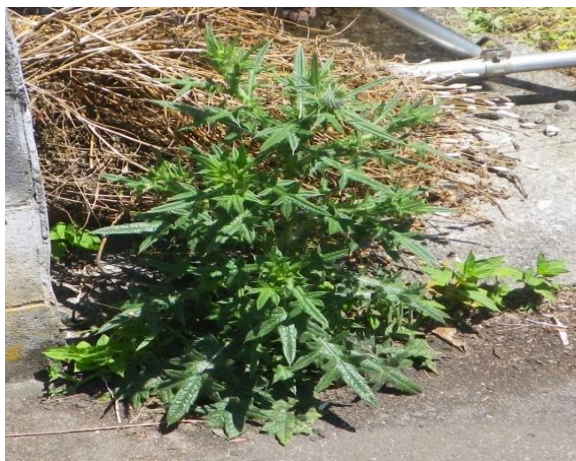
アメリカオニアザミ