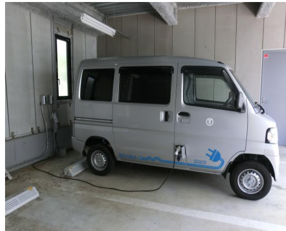
庁舎車庫・倉庫棟内充電設備