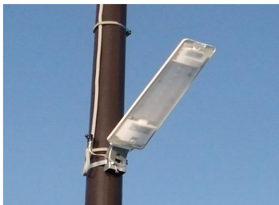
防 犯 灯