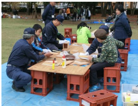
すずめの巣箱作り