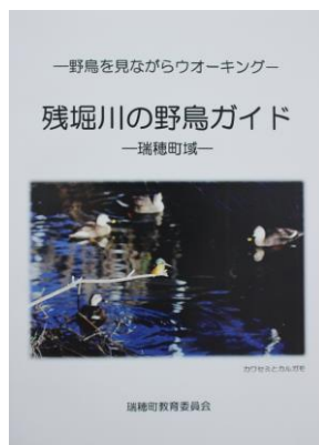
残堀川の野鳥ガイド