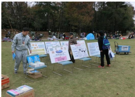
啓発パネルの掲示