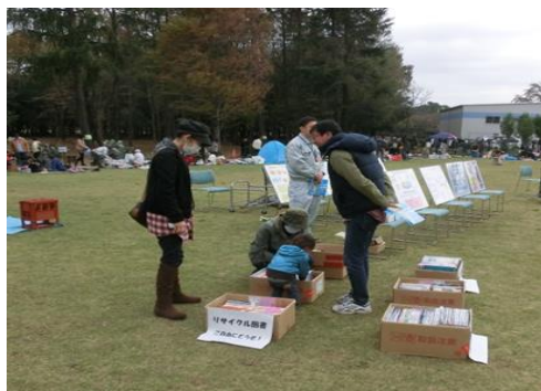
リサイクル図書の配布