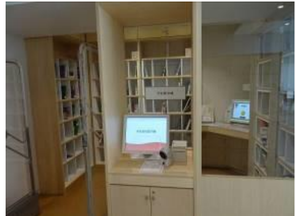
1階予約本自動貸出機