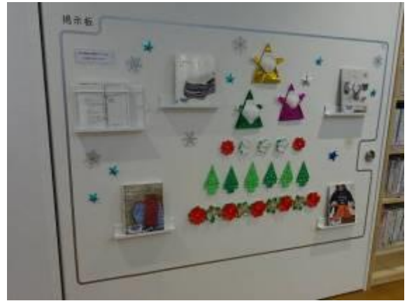
マグネット式掲示板