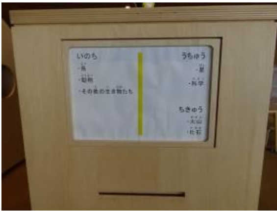
マグネット式の交換可能なサイン