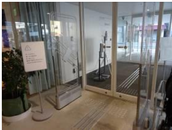
出入口の盗難対策ゲート