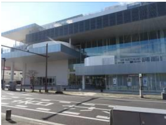
須賀川市民交流センターtette 外観