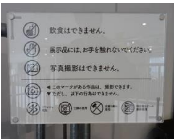
飲食・撮影注意サイン