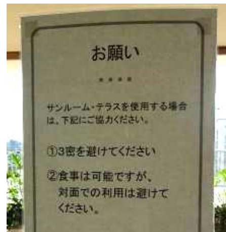
コロナ関連サイン