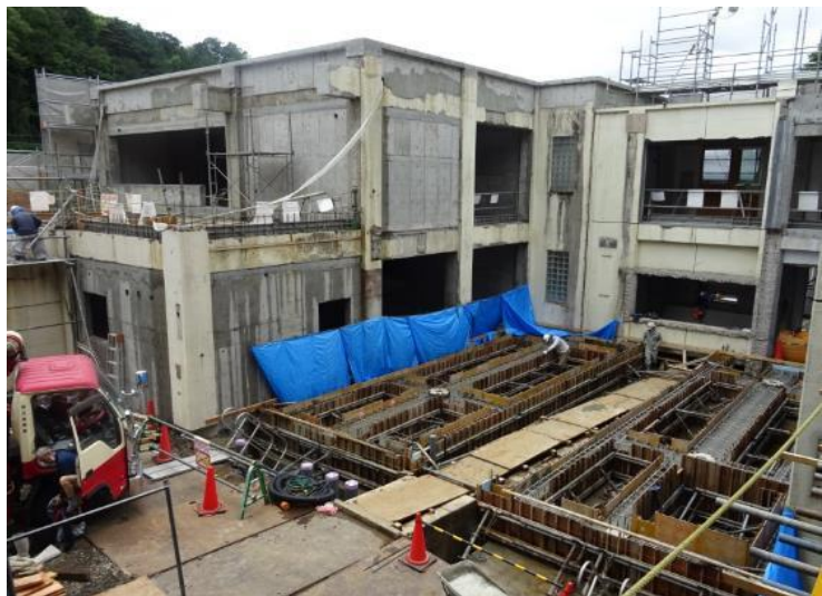
北棟増築予定部分