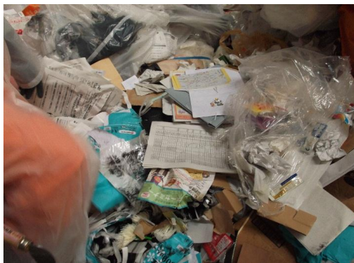
資源として出せるもの