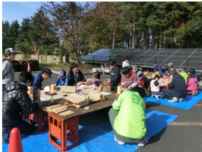
環境啓発事業（すすめの巣箱作り）

○今年度も環境啓発事業を実施し、町民の自然環境学習に触れる機会を提供していきます。