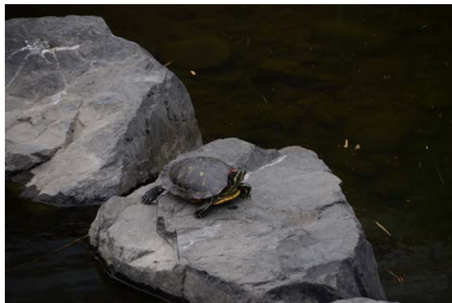
ミシシippアカミミガメ（ミドリカメ）

○今後も引き続き、外来種対策を実施することで、町内の生物多様性の保全を図っていきます。