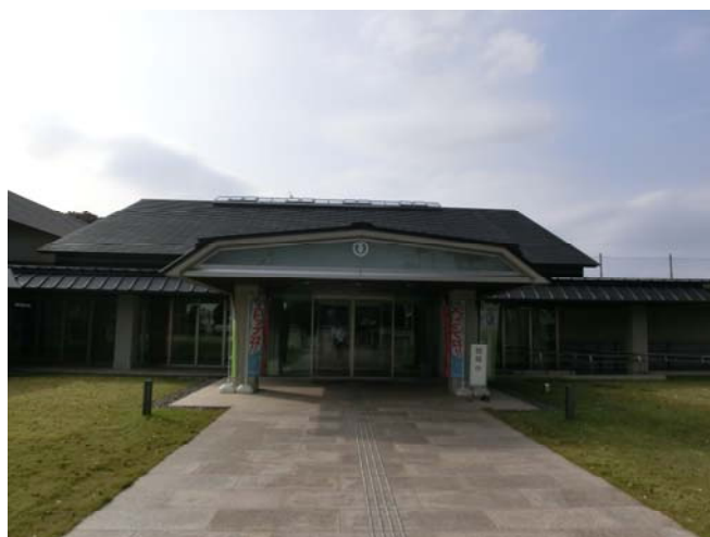
郷土資料館「けやき館」

○今後も公共施設を建設する際は、自動照明設備や太陽光発電設備等の新エネルギーの導入に取り組んでいきます。