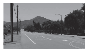
モーガンヒル市の西側に位置するエルトロの丘