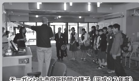
モーガンヒル市役所訪問の様子(平成27年度)