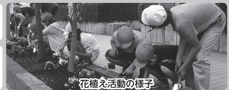
花植え活動の様子

上記の活動はほんの一例です。ほかにも各校の地域の特色を生かした「みずほ学」を展開していきます!!