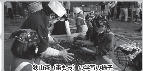
狭山茶(茶もみ)の学習の様子