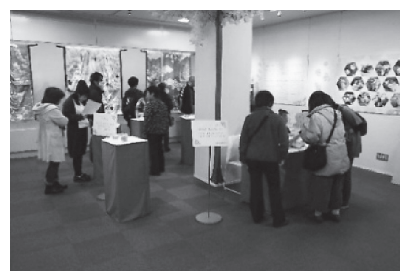
けやき館企画展の様子