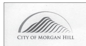
モーガンヒル市のロゴ

夏場でも朝夕の冷え込みが強く上着が必要なほどです。時折、台風や竜巻に見舞われることがありますが、降雪はほとんどなく、年間平均雨量は480mmで、夏季は乾期が続きます。