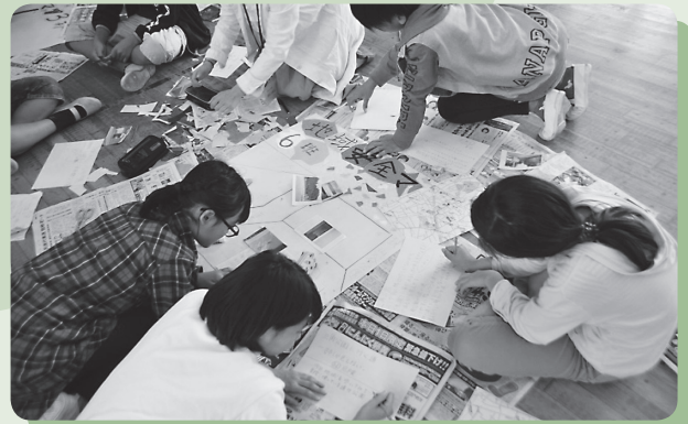
フィールドワークで集めた情報を基に 地域安全マップを作成

「地域安全マップ」とは、「犯罪が起こりやすい場所」(誰もが「入りやすく」、誰からも「見えにくい(見られにくい)場所)」を風景写真を使って解説した地図です。この「地域安全マップ」は、地図の作成を通じ、子どもに周囲の様子から犯罪が起こりやすい場所を判断する力を身に付けさせ、危険な場所には近づかない、または警戒する意識を育むためのものです。