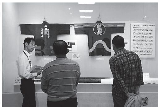
ギャラリートークの様子