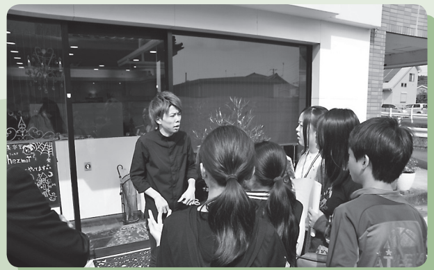
フィールドワーク 地域住民の方に周辺の状況をインタビュー