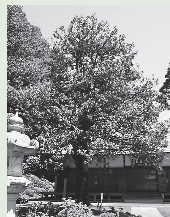
福正寺の多羅葉樹

多羅葉の名は、葉に経文を書いたというヤシ科の ばいたら 貝多羅樹の葉（貝多羅葉）になぞらえたものです。