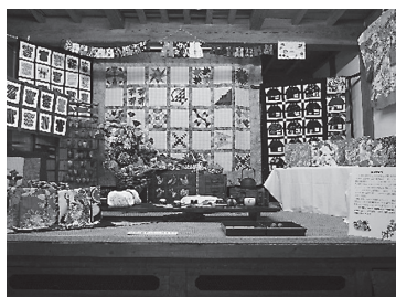
土蔵での展示の様子

平成28年9月3日から9月11日まで、企画展「瑞穂のパッチワーク～スーちゃん和瑞穂の秋～」を開催しました。JAにしたま瑞穂女性部に制作のご協力をお願いし、2年ぶりにパッチワークキルト作品の展示を行いました。村山大島紬をまとった瑞穂特別バージョンの「サンボンネット・スー」（人気のアップリケモチーフ）を始め、縦2m×横5.2mの「瑞穂ー大きなパッチワーク」、着物や古民家モチーフのパッチワークといった作品が勢揃いし、瑞穂町の伝統とパッチワークの伝統とが見事に融合した展示となりました。