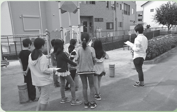
フィールドワーク 普段利用する公園も危険な場所かどうか確認