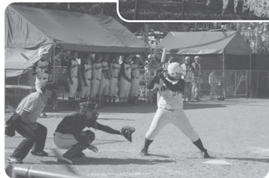
▲ 昨年開催した、ぎふ清流国体の様子

日程 9月29日(日)～10月1日(火) 会場 シクラメンスポーツ公園/瑞穂町営第2グラウンド 問合せ スポーツ祭東京2013瑞穂町実行委員会事務局 ☎557-8019(社会教育課内)