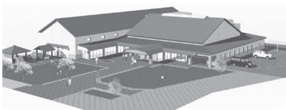
▲(仮称)新郷土資料館完成予想図