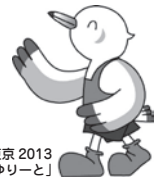
スポーツ祭東京2013 「ゆりーと」

申込み 6月3日(月)から7月31日(水)までに、参加申込書にご記入の上、お申し込みください。※先着順 参加申込書は町の公共施設に設置してあるほか、町のホームページ( http://www.town.mizuho.tokyo.jp/ )からダウンロードもできます。