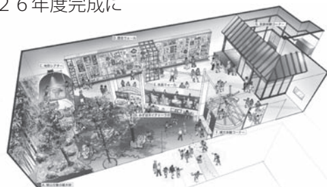
◀常設展示室予定図