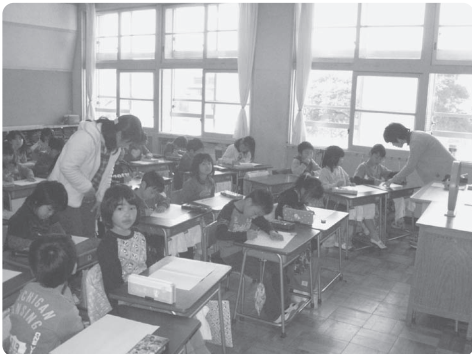
○学習サポーター事業は防衛省の補助金(再編交付金)を活用しています。