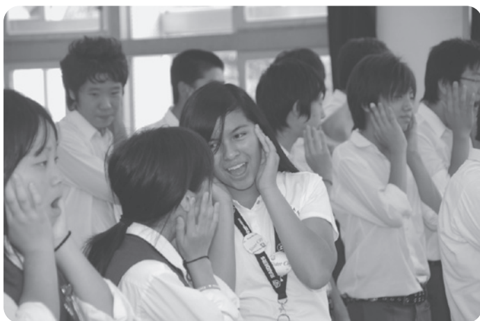
▲瑞穂中学校で音楽の授業を体験

姉妹都市であるアメリカ モーガンヒル市に、昨年度初めて町内在住の中学生6名を派遣しました。