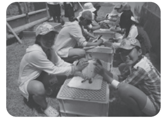
▲海洋センターでウミガメの甲羅の掃除を体験