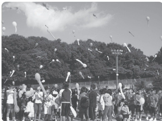
▲去年のこどもフェスティバルの様子

日時 10月18日(日) 午前9時30分開会 会場 ビューパーク競技場・スカイホール テーマ 「子どもたちとのふれあい まずはあいさつから」 内容 縁日(輪投げ、クラフト等) 発表(新体操、ダンス等) 食育(焼きそば等)