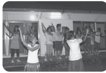
▲現地の小・中高生とフラダンスによる交流

この様子は、10月18日（日）のこどもフェスティバルで、隊員によるスライドを交えた発表会や写真展示が行われます。