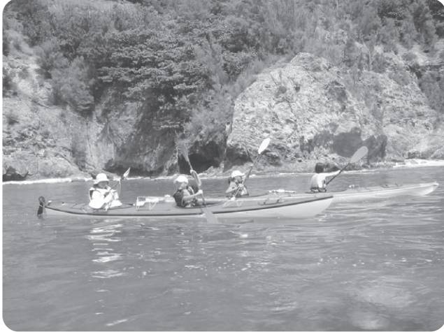
▲シーカヤック体験（昨年の小笠原村への派遣事業）

国際感覚を養う施策として、姉妹都市である米国モーガンヒル市から中学生を受け入れ、学校体験を含めた交流を行います。