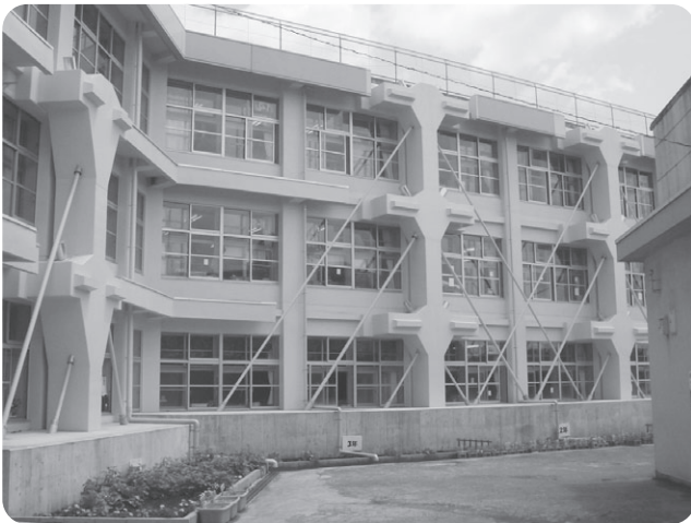
▲耐震補強工事が完了した一小