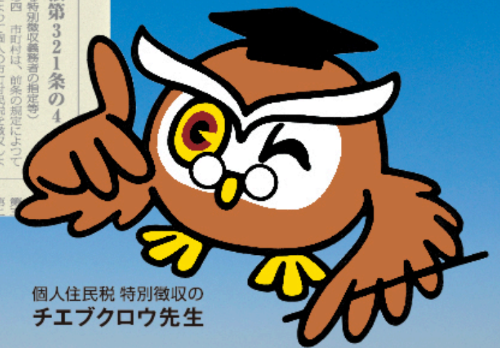
個人住民税 特別徴収のチエブクロウ先生