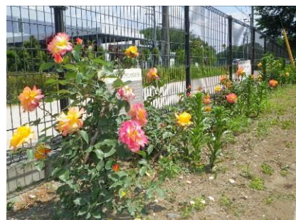
【地図番号⑥】 みずほエコパーク（駐車場、管理棟横） 平成23年2月 植樹