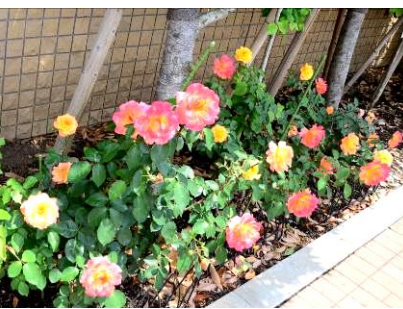
⑦長岡コミュニティセンター 平成23年11月 植樹