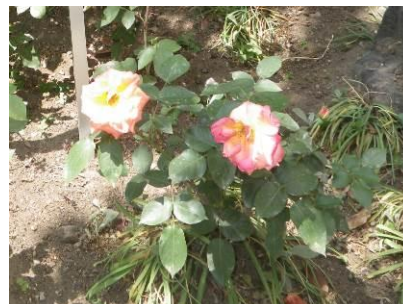
【地図番号④】 図書館 平成21年4月 植樹