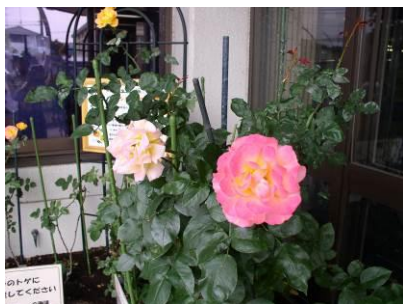
【地図番号①】 役場玄関前 平成18年3月 植樹