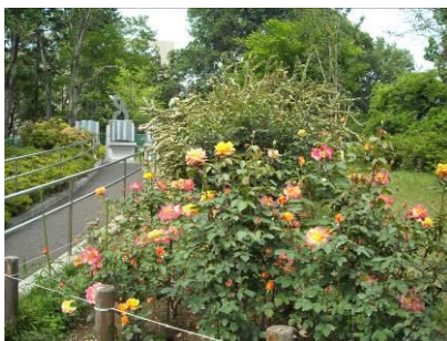
【地図番号②】 平和祈念碑 平成18年3月 植樹