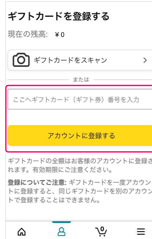
ギフトコード登録画面

ギフトコード(番号)にはグッピー ヘルスケアの当選メッセージの クーポンコードを入力。