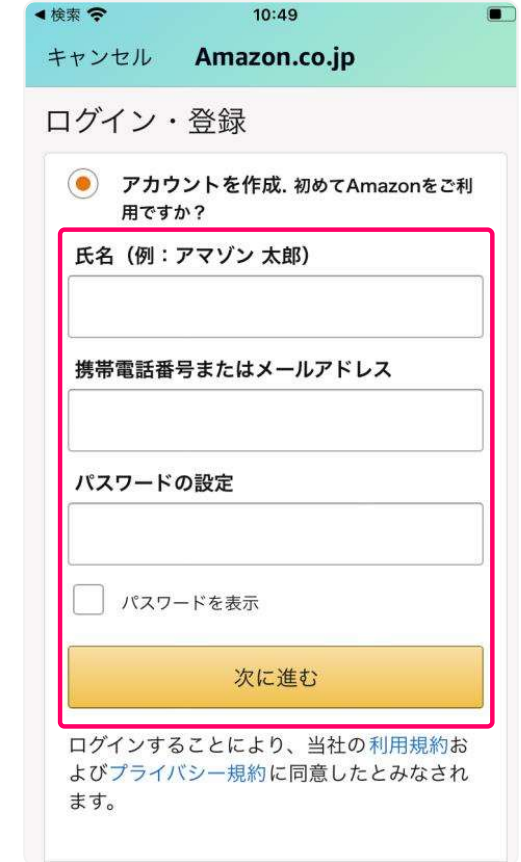
②の画面 (アカウント作成)

氏名・携帯電話番号またはメー ルアドレス、パスワードの設定 を入力後、 次に進む をタップ