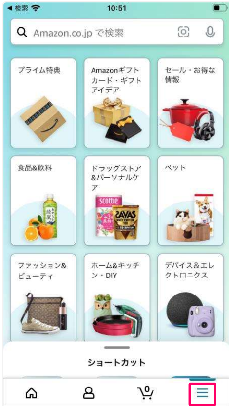
ログイン後の画面