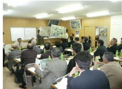
先進地視察の様子

●オオタカ保全計画検討会 オオタカの保全について有識者等とともに、検討を行っています