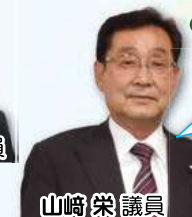
山崎 栄 議員

モノレール延伸を見据え、沿線のまちづくり、駅周辺の整備、地域公共交通や人口減少に対応した総合的な取り組みに期待。