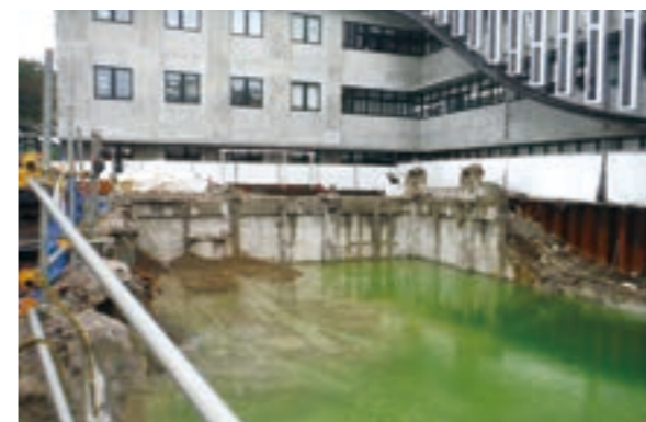
既存庁舎の地下部分の解体工事中に想定以上の湧き水が発生し、工事現場内にたまってしまった(5月19日の様子)。そのため、この水の処理作業が必要となった。

外構工事の作業中、想定以上の湧水が生じたことに対する対策経費や既存庁舎の解体工事において追加の工事を要するため、契約内容の変更を行うものです。工事費用は総額で35億8966万5600円となります。