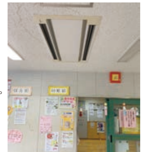
あすなろ児童館の天井埋込型の空調機

契約金額 115,302,000円(落札比率80.01%) 契約相手 八重洲工業株式会社(立川市) 工期 令和3年2月28日まで