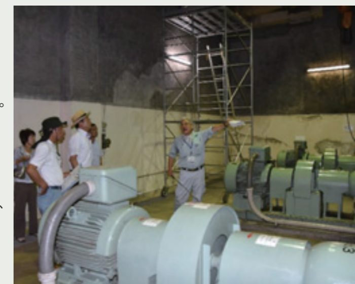
污水ポンプの説明を受ける様子

今後は、施設全体の長寿命化や圧送経路が1路線のため、複線化などの対策を計画的に実施する必要がある。