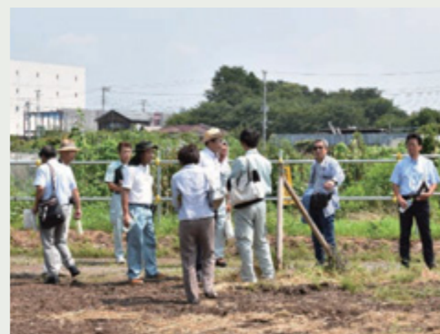
ひまわり畑の現況説明を受ける様子