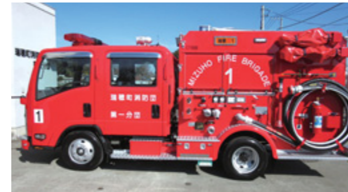
2年前に購入された同種の消防ポンプ自動車

第3分団の現有消防車両は、購入後15年が経過し、老朽化により消防活動に支障を来すおそれのあることから、買い替えを行うものです。なお、現有車両より車体が小さくなることから、道幅の狭い道路への進入が容易になり、より一層の消防力の充実が期待されます。